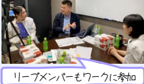
Leapメンバーもワークに参加