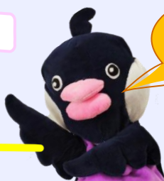
ブンちゃんもバッチリサポートしたブン！