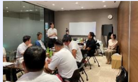
最初から最後まで真剣！